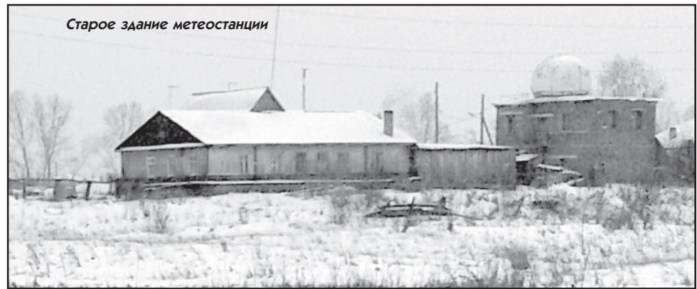
Старое здание метеостанции