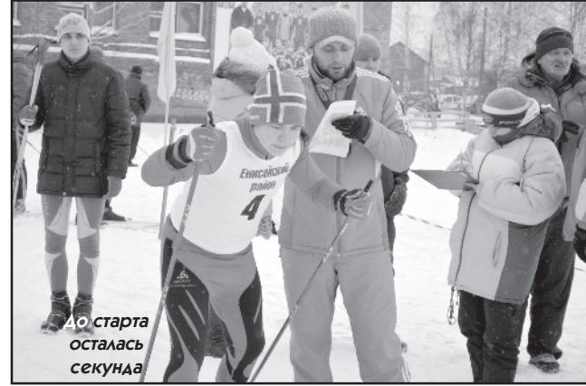
На старта осталась секунда