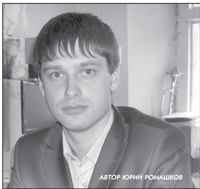
АВТОР ЮРИЙ РОМАШКОВ

Начало возрождения музея можно отнести к середине или к концу 1920 г. На этом этапе происходило восстановление ценностей, особенно много вре-