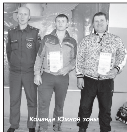
Команда Южной зоны