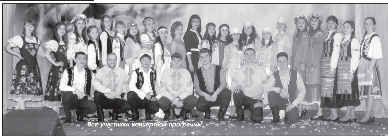
Все участники концертной программы

щественной организации «Татарская национально-культурная автономия» завершилось интересным концертом с ретроспективой этапов форума на экране и вручением благодарственных писем организаторам и активистам. В концертной программе, открывшейся флэшмобом с флагами разных стран, приняли участие гости из Красноярска. Фестиваль проходил в день 80-летия Красноярского края,