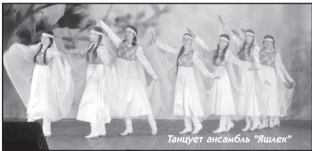
Танцует ансамбль «Яшлек»

Трёхмесячное общение юношей и девушек под эгидой об-