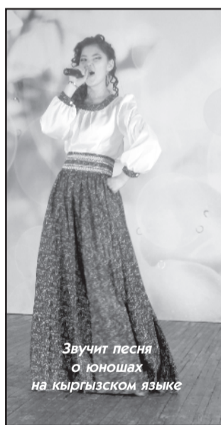
Звучит песня о юношах на кыргызском языке

Недавно девушки впервые приняли участие в межнаци-