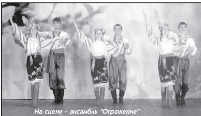
На сцене - ансамбль «Отражение»