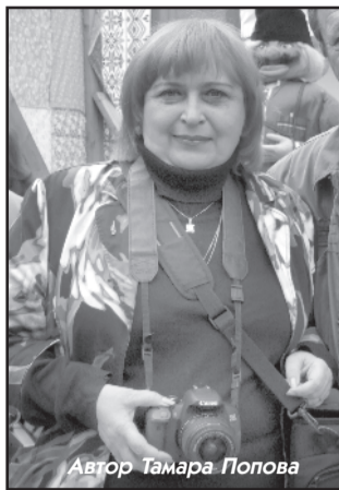
Автор Тамара Попова

В Маклаковском доме культуры состоялся итоговый фестиваль молодёжного форума «Под одной крышей»