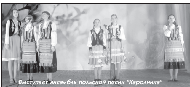
Выступает ансамбль польской песни «Каролинка»