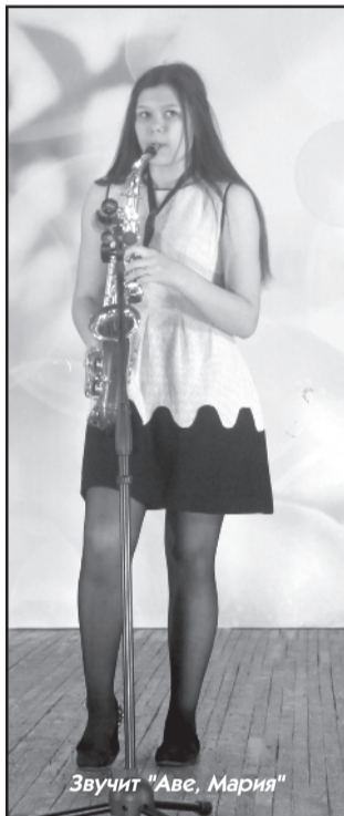
Звучит «Аве, Мария»