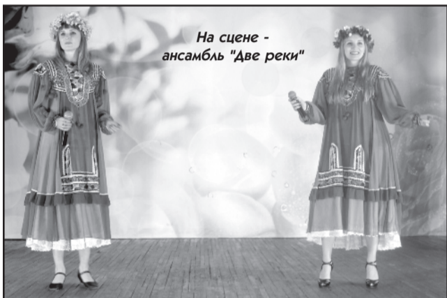
На сцене - ансамбль «Две реки»