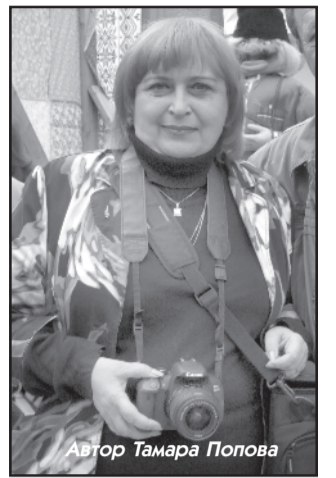
Автор Тамара Попова

ошибки добро и зло, преданность и предательство, благородство и подлость, вечность и мимолётность.