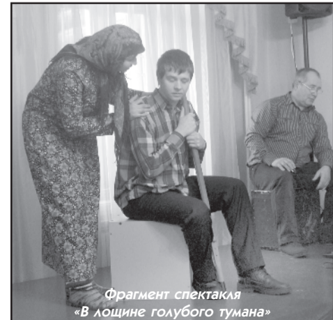
Фрагмент спектакля «В лошине голубого тумана»

борка рассказов в этой книге очень полезна для молодёжи, ведь именно в этом возрасте человек впервые по-настоящему задумывается над тем, как в большой жизни, куда он вступает, распознать без