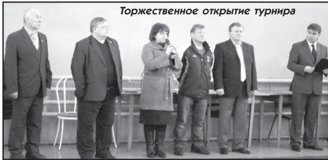
Торжественное открытие турнира

демонстрировал каскад разнообразных приёмов, ошеломив своих сверстников, и чётко припечатывал