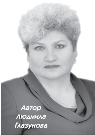
Автор Людмила Глазунова

Сибирь — серебряный иней полей, Могучий седой богатырь Енисей. Сибирь — необъятный заснеженный край, Приют журавлиных вернувшихся стай. Сибирь — это слово, и дело, и пот, Единства России надежный оплот.