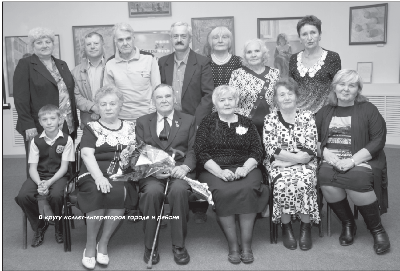
В кругу коллег-литераторов города и района