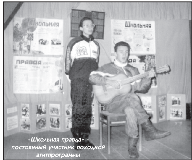
«Школьная правда» — постоянный участник походной агитпрограммы

раза в месяц и постоянно была насыщена информацией, анализировала, подводила итоги, всегда поддерживала новые, полные начинания. Широкая, постоянно действующая юнкорская сеть Пресс-центра позволяла