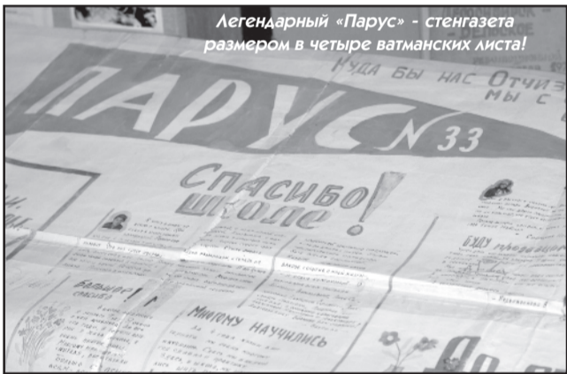
Легендарный «Парус» - стенгазета размером в четыре ватманских листа!

За долгие годы существования человечества накопилось множество способов передачи информации, и, если в Древней