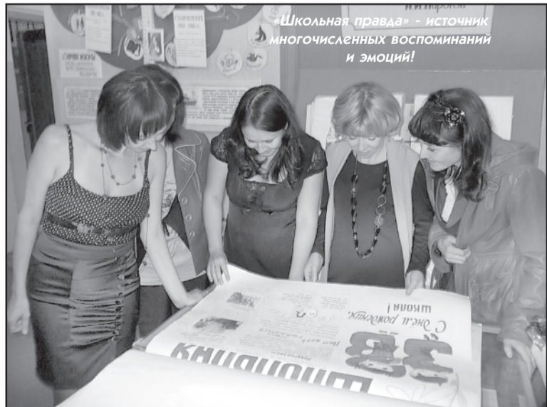
«Школьная правда» — источник многочисленных воспоминаний и эмоций!