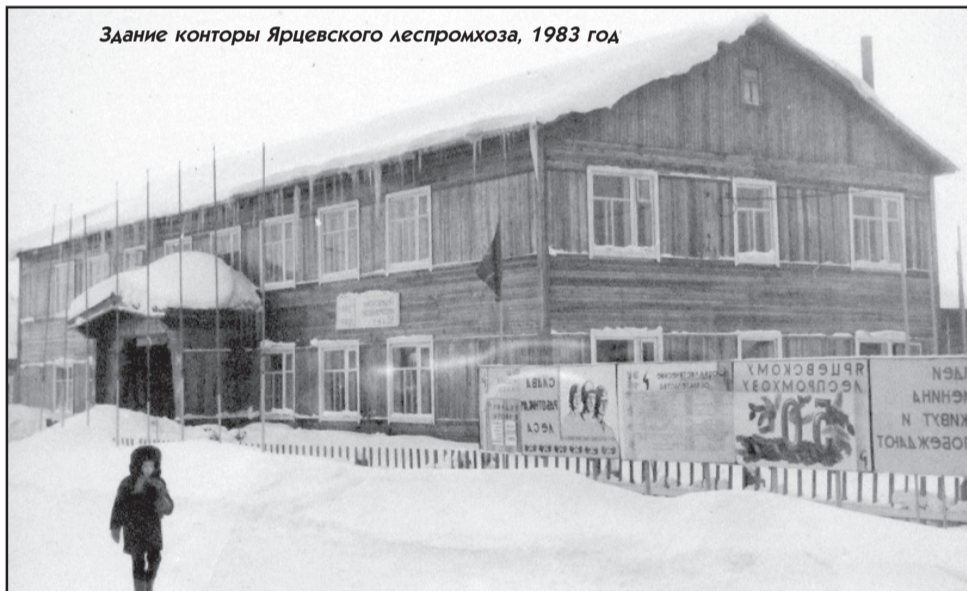
Здание конторы Ярцевского леспромхоза, 1983 год

1953 году в Ярцевском ЛПХ рабочих было 683,