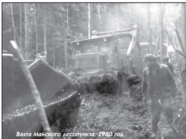
Вахта Майского лесопункта, 1980 год

где располагались лесозаготовки леспромхоза: Новый Городок, Майское, Кривляк, Зотино, Ворого-