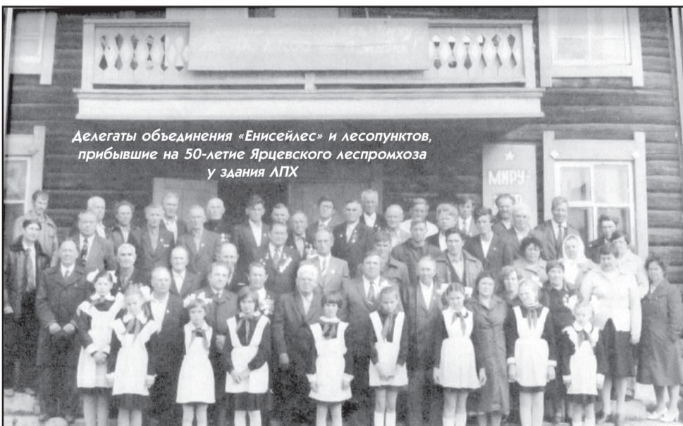
Делегаты объединения «Енисейлес» и лесопунктов, прибывшие на 50-летие Ярцевского леспромхоза у здания ЛПХ

лошадей — 167, электростанций — 12, тракторов — 9, мотовозов — 2, автомашин — 5. Комплексная выработка на одного рабочего составляла 210%. Стахановцев стало 230,