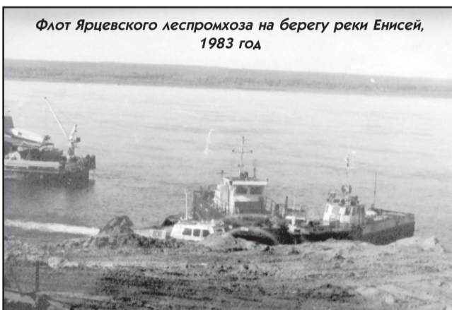
Флот Ярцевского леспромхоза на берегу реки Енисей, 1983 год