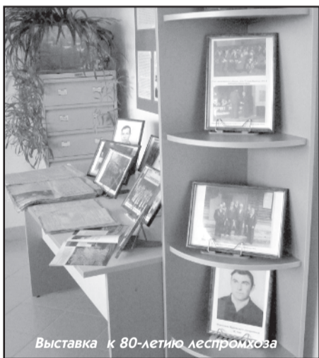
Выставка к 80-летию леспромхоза

операторы валочных машин, трактористы по вывозке хлыстов на трелев-