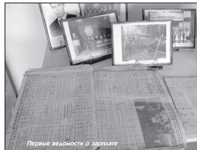
Первые ведомости о зарплате