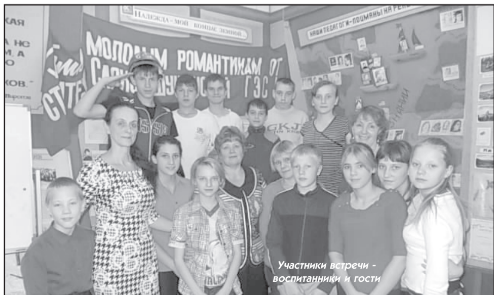
Участники встречи — воспитанники и гости