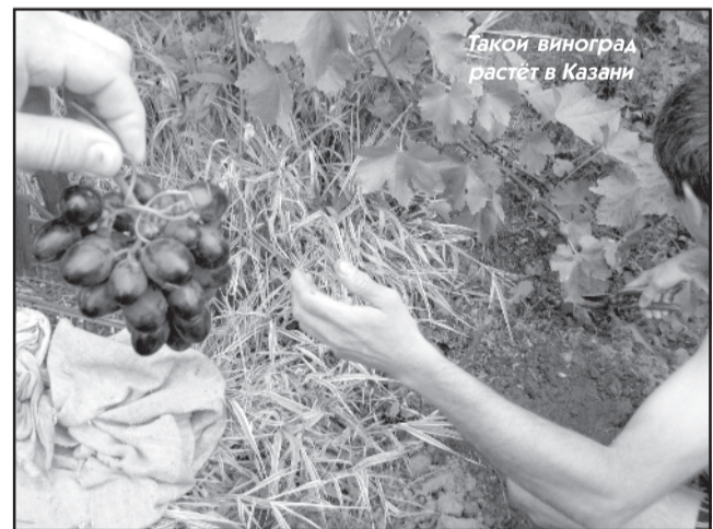
Такой виноград растёт в Казани

дороже на полтора-два рубля и на указателях отсутствовало расстояние до того или иного населённого пункта. Чуть ли на каждом километре установлены мобильные радары гаишников, собирающие свою каждодневную дань с несчастных автомобилистов. У брата в салоне постоянно пищал антирадар, предупреждающий об очередной «засаде» инспекторов.