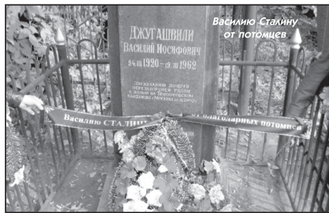
Василию Сталину от потомцев

Далее путь лежал на набережную. Рафиз признался, что сам здесь никогда не бывал. Набереж-