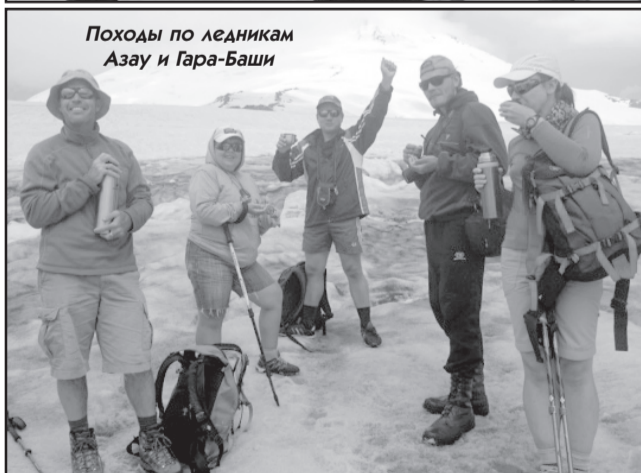
Походы по ледникам Азау и Гара-Баши