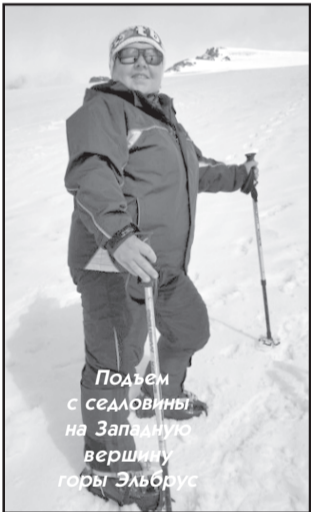
Подъем с седловины на Западную вершину горы Эльбрус