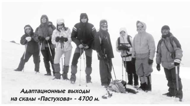
Адаптационные выходы на скалы «Пастухова» - 4700 м.