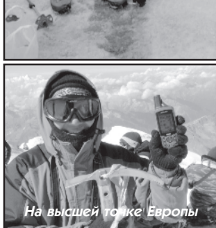
На высшей точке Европы