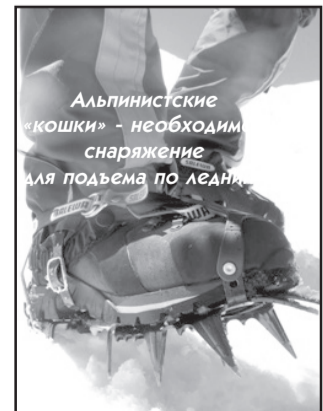
Альпинистские «кошки» - необходимое снаряжение для подъема по леднику