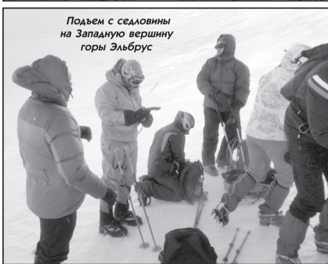
Подъем с седловины на Западную вершину горы Эльбрус