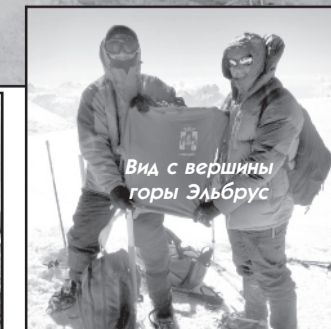
Вид с вершины горы Эльбрус