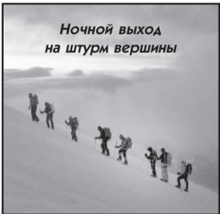
Ночной выход на штурм вершины