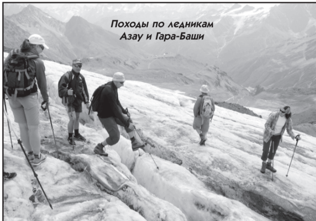
Походы по ледникам Азау и Гара-Баши