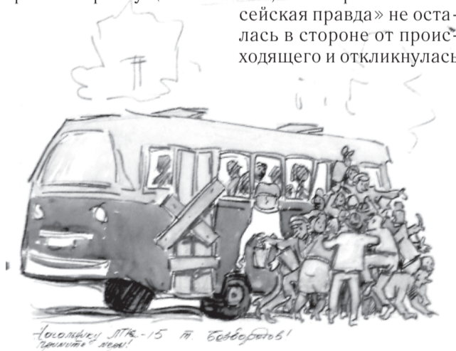
Ассальби, 11/15 14. Безбородов!

Таким образом, не смотря на некоторые недостатки, свойственные в этот период не только «Енисейской правде», но и прочим периодическим изданиям, отметим, что обличительные статьи играли отчасти воспитательную роль в духе