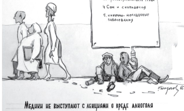
Медики не выступают с лекциями о вреде алкоголя