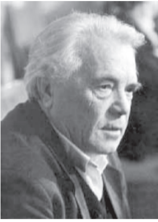
Окончание, начало в № 11

- Ишь, заживут! — опять построжел отец. — Да у тебя весь живот в крови. Так и в больницу недолго угодить. Живо иди в дом и царапки замажь зеленкой.