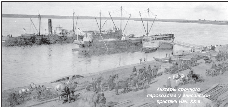
Лихтеры срочного пароходства у енисейской пристани Нач. XX в

стала из пароходов германского производства. Это прописано в отчёте экспедиции: "За краткостью оставшегося времени и отказом русских заводов от изготовления нужных судов, единственным путём оставалось приобретение флотилии путём покупки". Важно отметить, что "Казённая флотилия" была организована в рамках проходившей экспедиции. Именно этот фактор сыграл роль в развитии государственного пароходства на Енисее. Казённая флотилия и Енисейское пароходство некоторое время существовали вместе. Стоит лишь предположить, что постепенно участ-