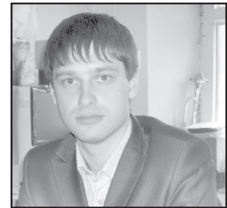
АВТОР ЮРИЙ РОМАШКОВ

По материалам фондов ЕКМ научный сотрудник фондов музея РОМАШКОВ Ю.В.