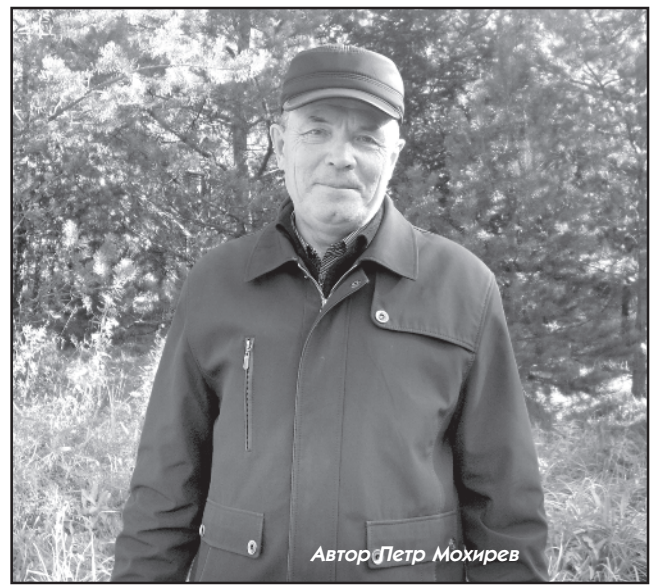
Автор: Петр Мохирев

И снова мерно пел свою песню за короткой мотор. Обратное было гораздо легче, надо было лишь поддерживать работу мотора на малых оборотах и управлять лодкой, течение же делало своё дело, мы спустились с верховьев Дубчеса. Я уже не смотрел с любопытством на берега, не любовался северными таёжными красотами, на душе была неприятная горечь после прощания с матерью. Я увидел хотя бы поверхностно безрадостную жизнь таёжных людей, у них нет никаких благ: ни радио, ни телевидения, ни больниц и магазинов, ни благоустроенных квартир с горячей водой. Они живут в одном тёмном и низком бараке с тесными проходами между двухъярусных топчанов, они отказались от мясной пищи и едят два раза в день, да ещё и живут по какому-то своему времени, которое я никак не мог понять. Но с другой стороны, они же добровольно приняли на себя такие условия, добровольно отказались от благ цивилизации и уехали так далеко в тайгу, чтобы жить в спартанских условиях. Всё их время уходит на моления и работу и они довольны своей жизнью и прежде всего тем, что много общаются с Богом.