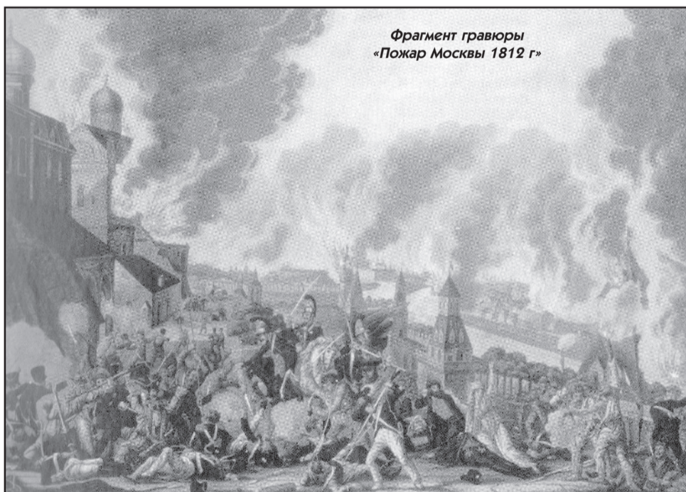
Фрагмент гравюры «Пожар Москвы 1812 г»

/.../ В пять часов по полудню зажгли во всех местах Москву. В одно время везде запылали: за нами, перед нами и со всех сторон. Такая ужасная картина представилась в эту ночь! Все считали, что это святое представление, к тому же поднялась такая жесточайшая буря, которая срывала с домов крыши и уносила на далёкие расстояния. Даже и к Москве - реке подступиться было нельзя/.../.