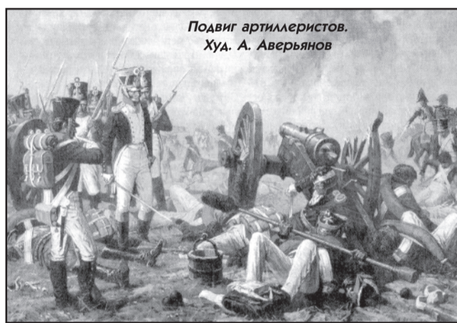
Подвиг артиллеристов. Худ. А. Аверьянов

/.../ Французы везде заняли дороги. С левой стороны Никитскую улицу французская колонна занимает, с правой - по Тверской - дру-