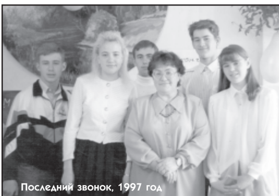
Последний звонок, 1997 год

Новый год семьёю встретим и проводим, И 8 Марта близко, на подходе. Острые сосульки вырастут на крыше, Солнце будет ярче, небо станет выше. И однажды сердце чутко встрепенётся, С журавлиным клином лето к нам вернётся, Всё в цветах, в потоках солнечного света, Мы его так ждали! Здравствуй, здравствуй, лето!