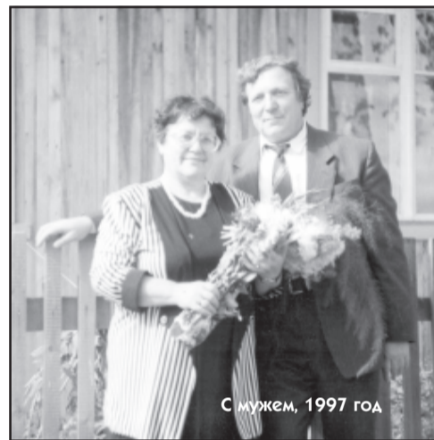
С мужем, 1997 год

С журавлиным клином лето улетает, Лёгкой паутиной в синем небе тает, До тепла нескорого с нами попрощалось, Грусть от листопада только и осталась. Зябкими ночами холодно рябинке, Доцвести торопятся астры-сентябринки, Жёлтая берёза свечкою пылает, Листики-монетки щедро рассыпает. Оттанцуют в воздухе листья золотые, И затянут небо тучи снеговые. На душе не весело, под ногами - слякоть, От такой погоды хочется заплакать. А когда ударит ледяная крупка, Из шкафов достанем валенки и шубки. Домики-кормушки у крыльца повесим, Чтоб весной дожждаться звонких птичьих песен.