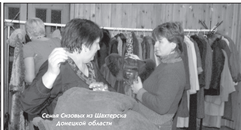
Семья Сизовых из Шахтерска Донецкой области