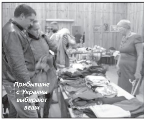
Прибывшие с Украины выбирают вещи

Завершилась торжественная церемония выступлением ансамбля танца Сибири имени Михаила Годенко и образцово-детской оперной студии Красноярского государственного театра оперы и балета.