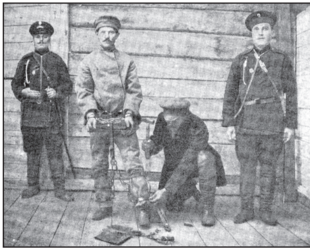
Закладка кандалника в кандалы. с литографии к. 19 нач. 20 в

В 1782 г., согласно «Учреждению о губер-