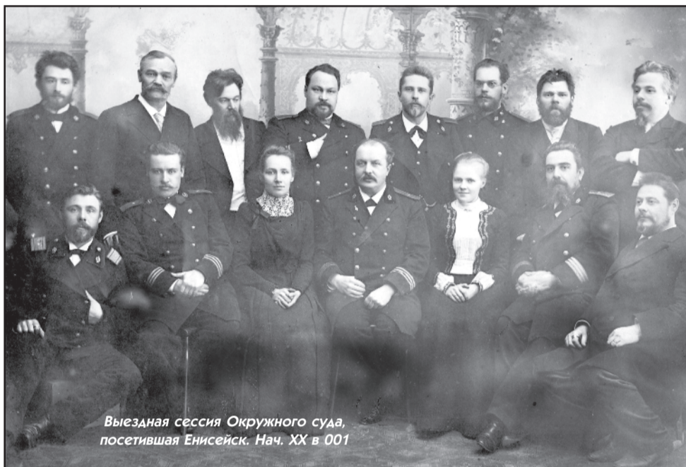
Выездная сессия Окружного суда, посетившая Енисейск. Нач. XX в 001

История государственного надзора за соблюдением законов и законности в Енисейске начинается с XVII века. В летописных сводах того времени упоминается впервые о местной исполнительной администрации острога. Она состояла из воеводы, в руках которого находились и судебные функции, его помощника - подьячего, на долю которого нередко выпадало следствие и судопроизводство. Также в документах 1623 г. по летописи Кытманова значатся так называемые «товарищи воеводы по письменной части».