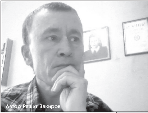
Автор Рашит Закиров