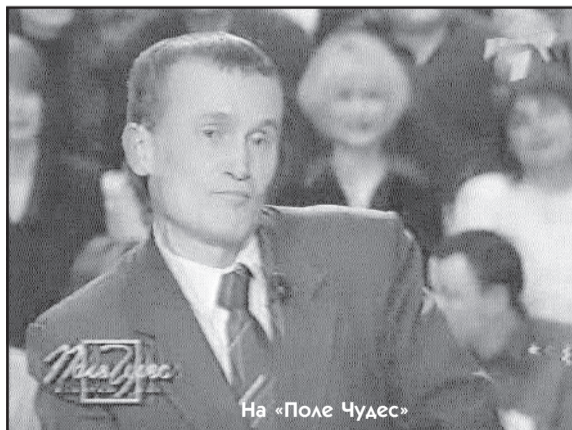
На «Поле Чудес»