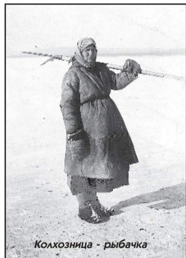
Колхозница - рыбака

лым (сказывалась нехватка денежных средств, что, впрочем,