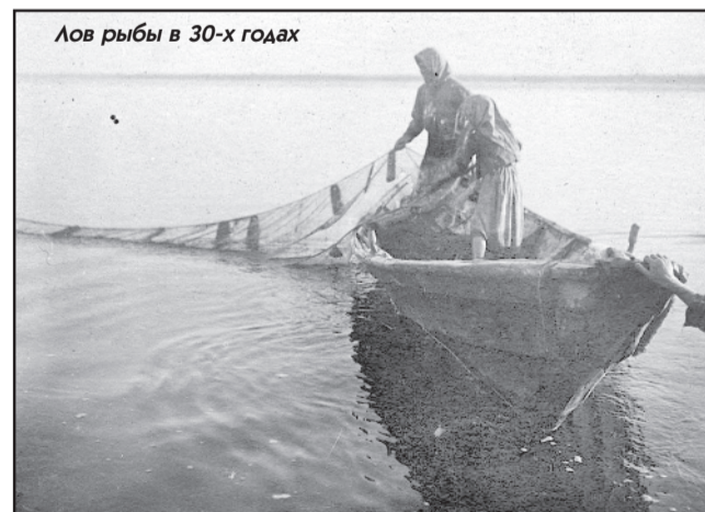
Лов рыбы в 30-х годах

зимнего лова, 100 пудов пробок бутылочных для самоловов. «Чтобы была правильная заготовка рыбы и избежать утечки рыбы на сторону, нужно установить приемочные и засолочные пункты в ниже указанных районах: в Подкаменной Тун-